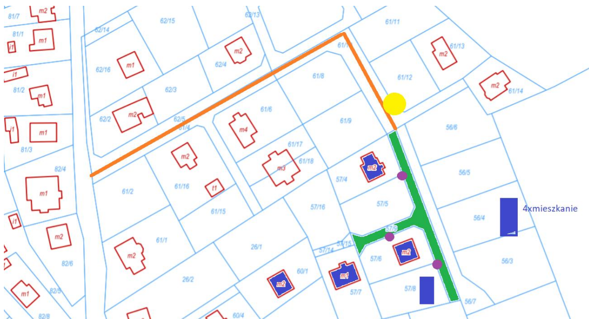
Rysunek 1 Plan sytuacyjny

Na rysunku poniżej na pomarańczowo zaznaczono utwardzoną część ulicy Gałczyńskiego, a kolorem zielonym oznakowano tę część ulicy, która wymaga utwardzenia. Kolorem żółtym oznakowano istniejący punkt oświetleniowy podczas, gdy fioletowe punkty to propozycja rozmieszczenia nowych punktów świetlnych, o których mowa we wniosku. Kolorem niebieskim oznakowano również budynki, dla których zielono oznakowana droga jest dojazdową.